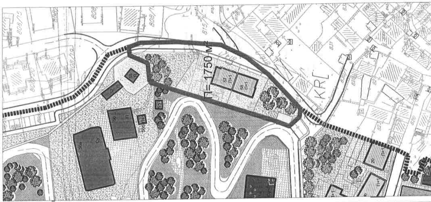
ОБУХВАТ 2 П= 1750 М²