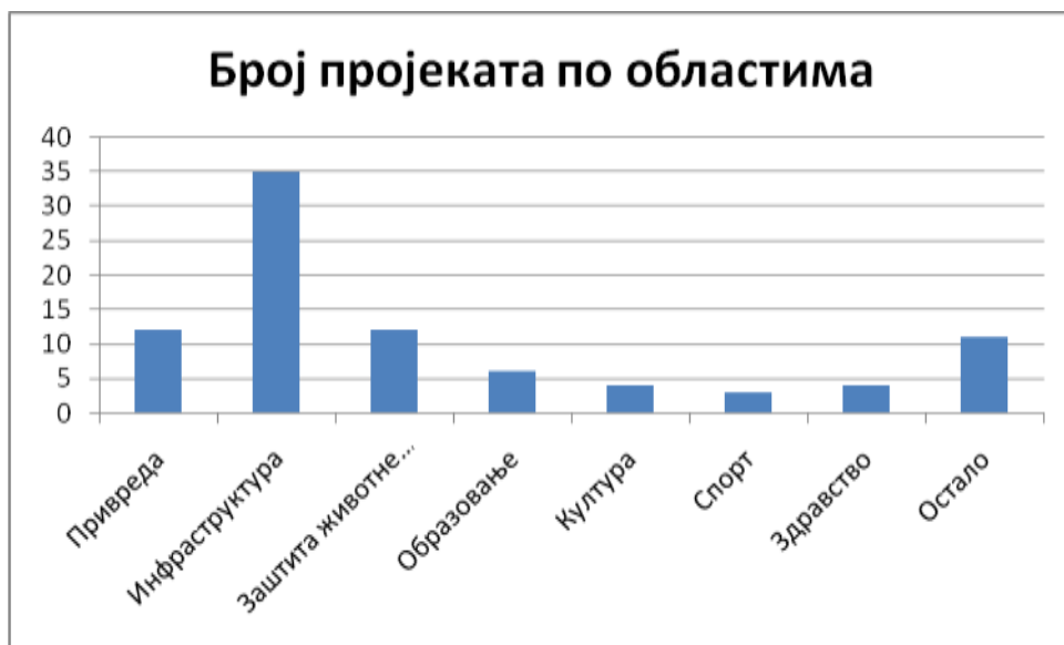
Број пројеката по областима-графички приказ

У средњорочном плану инвестиција налази се укупно 88 пројеката подијељених по областима, који ће се финансирати редовним средствима из буџета Града, кредитним средствима, донацијама и средствима јавних предузећа, Владе Републике Српске и сл.